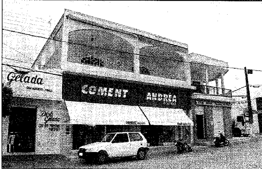
EM ADUSTINA, crianças jogam na terra. Acima, a casa do acusado