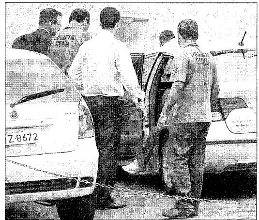
POLÍCIA investiga denúncia envolvendo funcionário do Fla

— É preciso mostrar a todos que este crime acontece do nosso lado. Os pais precisam ter mais atenção com os filhos — disse Liliam.